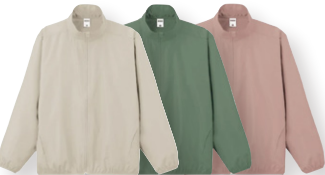
C-1(115/アイボリー) C-1(24/オリーブ) C-1(519/スモーキーピンク)