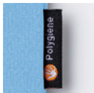
左側にポリジンネーム付き