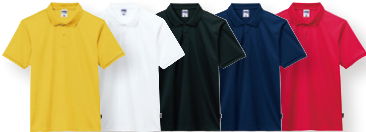
B-1(30/デイズ) B-1(15/ホワイト) B-1(16/ブラック) B-1(8/ネイビー) B-1(3/レッド)

※在庫状況により、売り切れや別カラーへの変更をお願いすることがございます。 ※商品には加工が入るため、返品・交換は出来ません。