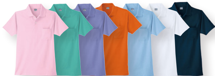
A-1(13/ピンク) A-1(35/エメグリーン) A-1(14/淡パープル) A-1(12/オレンジ) A-1(6/サックス) A-1(90/ホワイト) A-1(1/ネイビー)

※在庫状況により、売り切れや別カラーへの変更をお願いすることがございます。 ※商品には加工が入るため、返品・交換は出来ません。