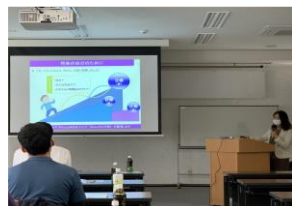
若い世代に向けた講習会