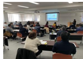
幅広い年齢層に向けた講習会