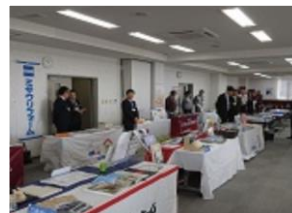
多くの住宅メーカーが参加