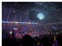
バスケットボール 観戦