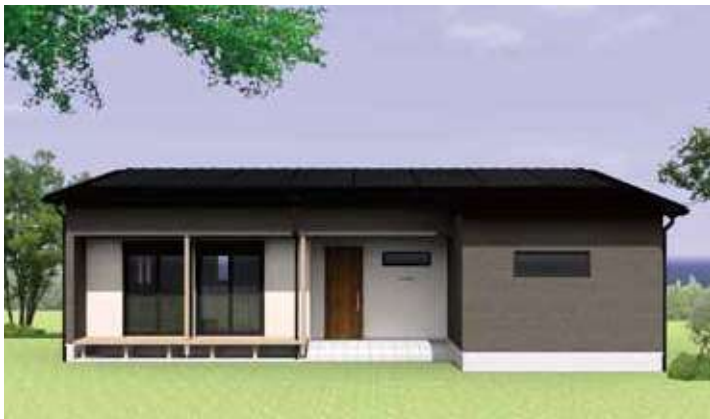
※パースはイメージです。

勾配天井とダウンフロアリビングの組み合わせにより、広開放的なリビング。大容量収納スペースをはじめ、キッチンから水回りまで一直線にまとめた動線など、普段の家事をより快適にする工夫が随所に施されたプランです。