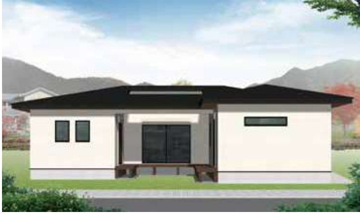
※パースはイメージです。

四季折々の自然を満喫できる平屋。すべてのお部屋がウッドデッキと地続きとなっているため、洗濯物を干したり、腰を掛けてお茶を飲んだり、趣味の読書を楽しんだりなど、利便性の良い間取りが特徴のプランです。